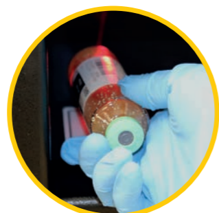
バーコードの読み取り